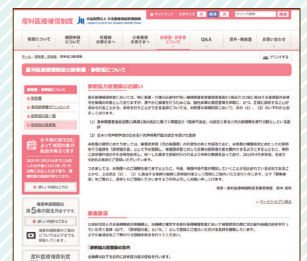
〈産科医療補償制度ホームページ 診断協力医制度登録について〉

〒101-0061 東京都千代田区神田三崎町1丁目4番17号 東洋ビル 公益財団法人日本医療機能評価機構 産科医療補償制度運営部 審査・補償 診断協力医担当 TEL: 03-5217-3188 メール: shindan@jqhc.or.jp